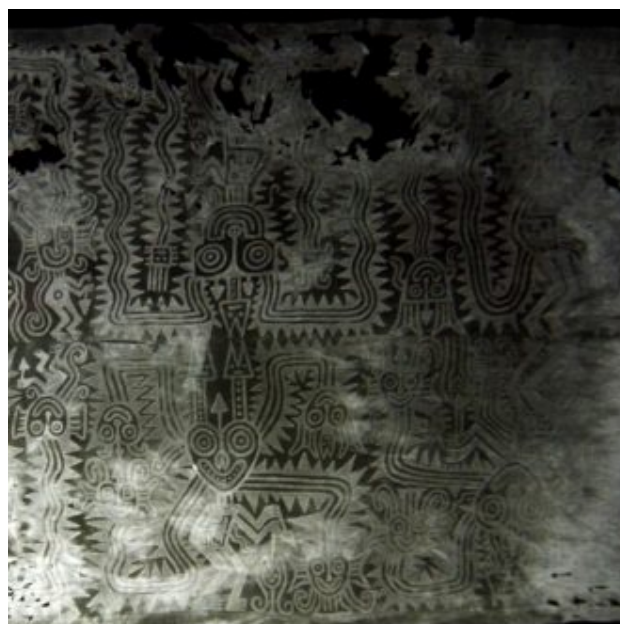
Img. 05: negativo mostrando el estado de conservación inicial del manto pintado en donde se puede observar, en la parte central, la huella de la base del fardo

Por lo tanto, haciendo un promedio de los datos, se puede deducir que la tumba estaba a una profundidad no menor a 2.75 metros de la superficie. Tenía una