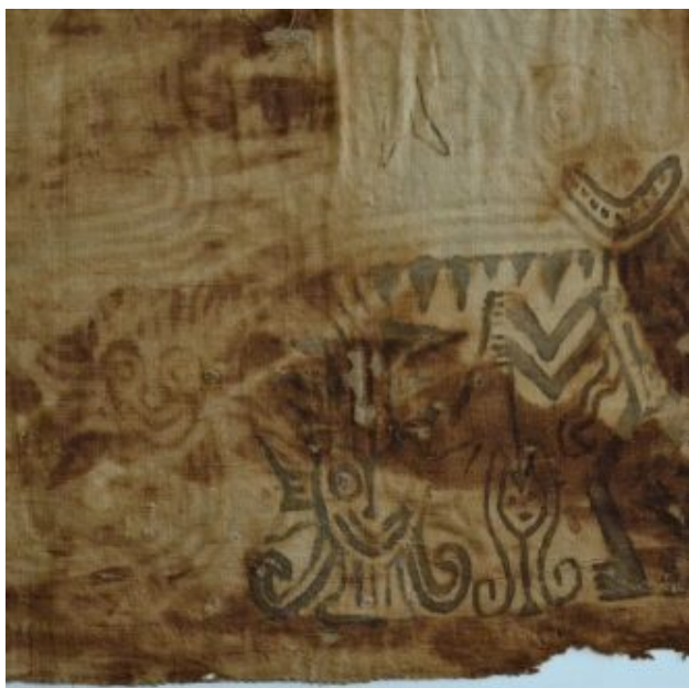
Img. 08: detalle del revés del manto donde traspasó la pintura.

paquete funerario fue colocado en este lugar para enfardelar el individuo. De esta manera, se propone que la parte izquierda del manto, el área más dañada por la acidez del deterioro del cuerpo, fue doblada hacia el individuo y luego la parte derecha de la tela fue envuelta encima del fardo dejando a la vista las figuras pintadas de trazo más oscuro. El estado de conservación de la pieza se alteró por dicho procedimiento.