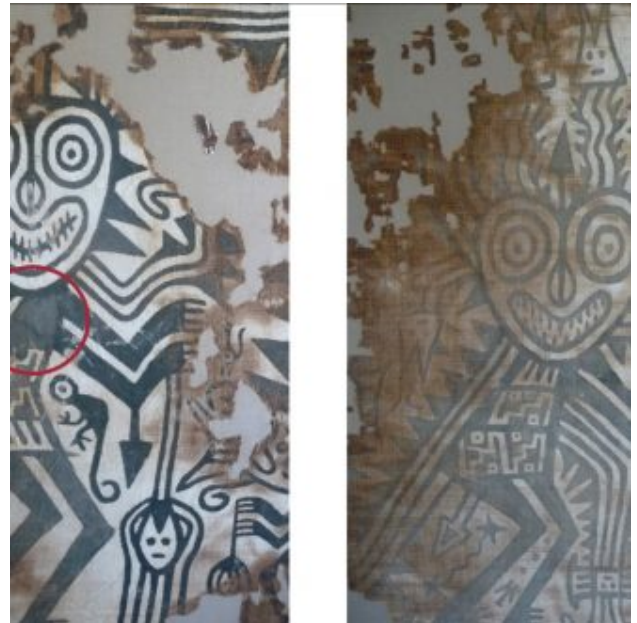
Img. 09: figuras donde se puede observar las capas (imagen izquierda) y los errores de pintura (imagen derecha).

hipótesis que la pieza fuese pintada después de haber unido sus paños. De hecho, se observa encima de la puntada de unión restos de pigmento que apoyarían este argumento.