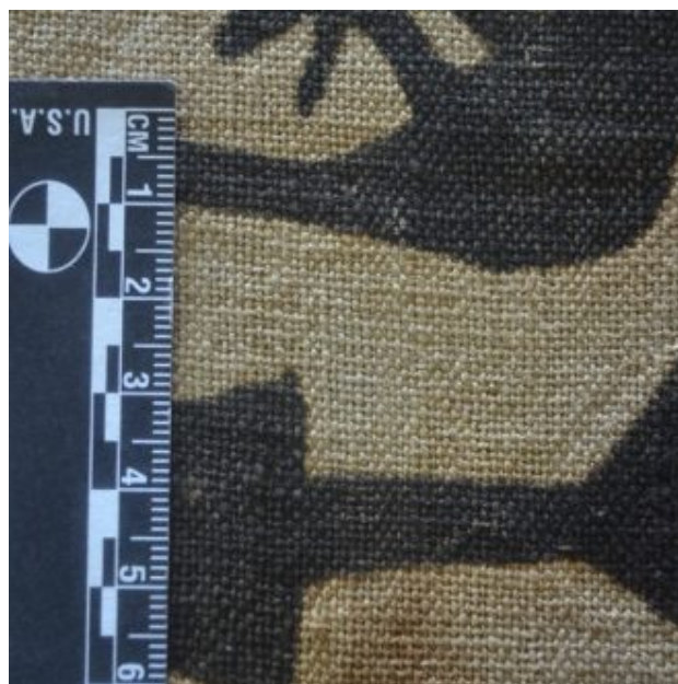
Img. 07: pigmento y grosor del pincel utilizados para pintar la tela.

159-161). Se menciona además dos otras telas pintadas en las capas más cercanas al individuo, pero no se tiene mayor descripción de las mismas. Este detalle llama la atención puesto que en ningún otro fardo de la tumba se hace mención del hallazgo de mantos pintados.