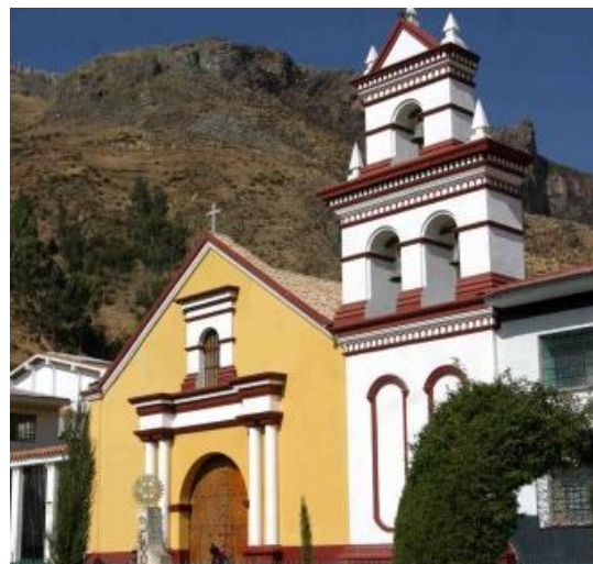
Iglesia San Juan de Dios

El cielo raso de la nave derecha está íntegramente cubierto con pan de oro. Destaca también la imagen del Señor del Prendimiento, cuya devoción convoca a miles de fieles en Semana Santa. Está ubicada en la plaza Bolognesi s/n. Data del siglo XVIII.