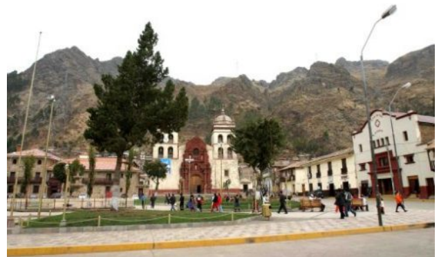
Plaza de Armas de Huancavelica

El departamento de Huancavelica celebró el 28 de abril su 179° aniversario de Restitución Política del departamento de Huancavelica con diversas actividades. Los actos continuarán esta semana y aprovechando el feriado conozca los hermosos atractivos turísticos de la región.