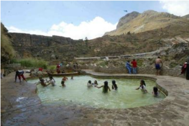
Aguas termales Seccsachaca "Villa Cariño"