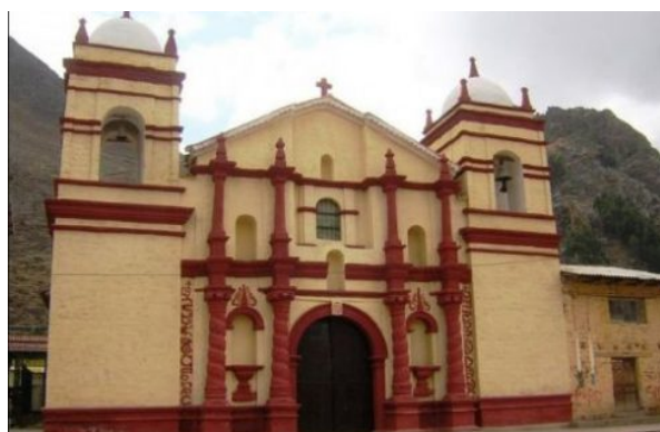
Iglesia y ex convento de San Francisco

Fue construida en 1774 y se conserva casi intacta pese a los movimientos sísmicos que han soportado. Es de estilo mestizo y en el interior se aprecian retablos barrocos, tallados en madera y bañados con pan de oro. Se ubica en la plaza Bolognesi s/n.