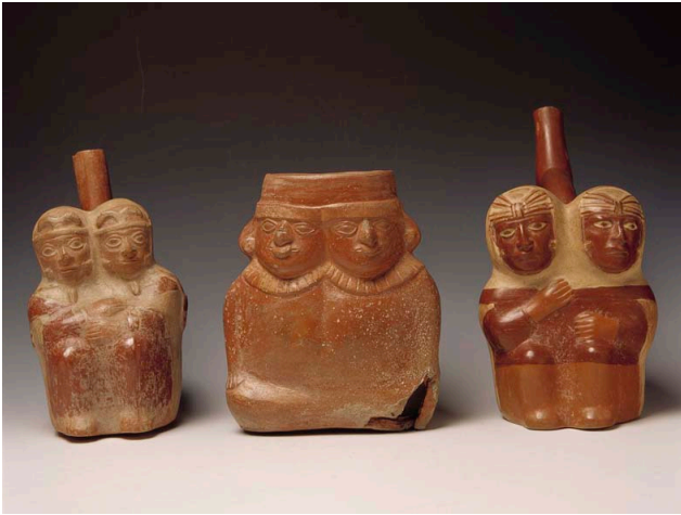
Cerámicas precolombinas de gemelos siameses del Museo Larco (Lima, Perú)

Se estima que uno de cada 75.000 nacimientos puede resultar en gemelos siameses. Las causas por las cuales los gemelos univitelinos no logran separarse durante el desarrollo embrionario aún son desconocidas. Lo cierto es que la mayor parte de los casos se dan en mujeres, principalmente, del tipo toracópago (unidos por el tórax). En los varones es común el tipo parápago (unidos lateralmente por la pelvis) y parasitario (donde uno es más pequeño y depende del otro).