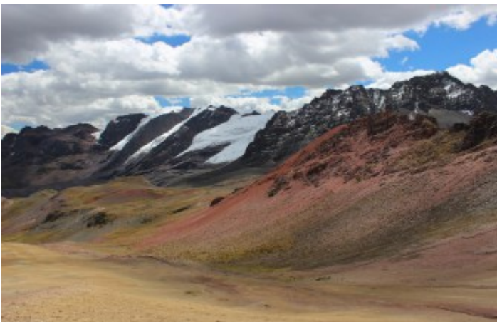
Valle de la Montaña de colores, Montaña Arco Iris, Rainbow Mountain (Jaime Briceno)