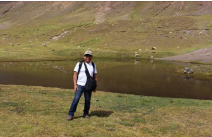
Valle Vinicunca (Jaime Briceno)