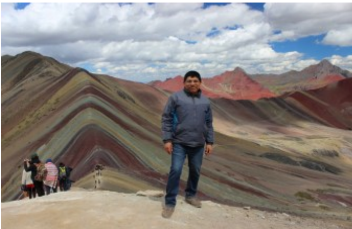
Valle de la Montaña de colores, Montaña Arco Iris, Rainbow Mountain (Jaime Briceno)