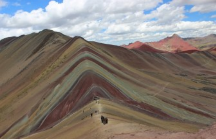
Valle de la Montaña de colores, Montaña Arco Iris, Rainbow Mountain (Jaime Briceno)