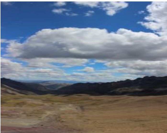
Valle de la Montaña de colores, Montaña Arco Iris, Rainbow Mountain (Jaime Briceno)