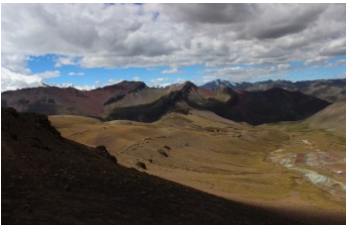
Valle de la Montaña de colores, Montaña Arco Iris, Rainbow Mountain (Jaime Briceno)