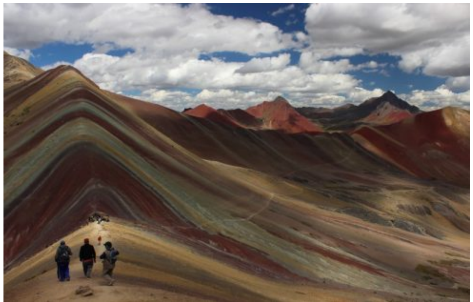
Montaña de 7 colores, Montaña Arco Iris, Rainbow Mountain (mas conocido por los locales como Cerro Colorado) (Jaime Briceno)

La Montaña de 7 Colores o Montaña Arco Iris (Rainbow Mountain) o mas conocido por los locales como Cerro Colorado, esta localizado en Vinicunca, provincia de Quispicanchis, departamento del Cusco. Sus formaciones geológicas revelan todo su esplendor, en contraste con el cielo azul formando una barrera formidable entre el desierto de la costa y la selva amazónica, dominado por el hermoso nevado Ausangate (6384 m), uno de los grandiosos apus de esta región.