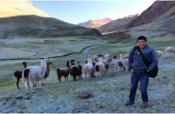
Valle Vinicunca (Jaime Briceno)