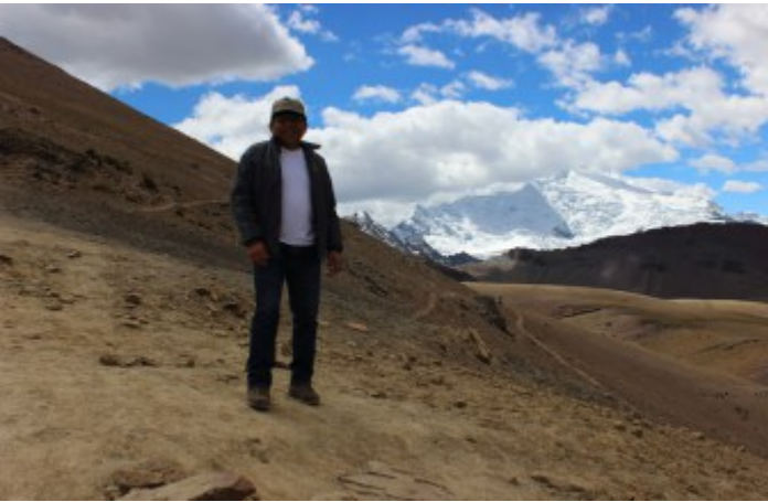
Valle Vinicunca, al fondo el nevado Ausangate (Jaime Briceno)