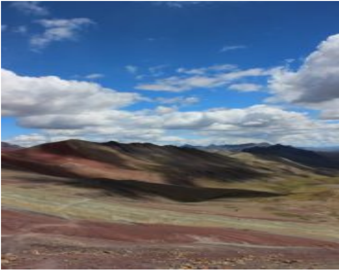
Valle de la Montaña de colores, Montaña Arco Iris, Rainbow Mountain (Jaime Briceno)