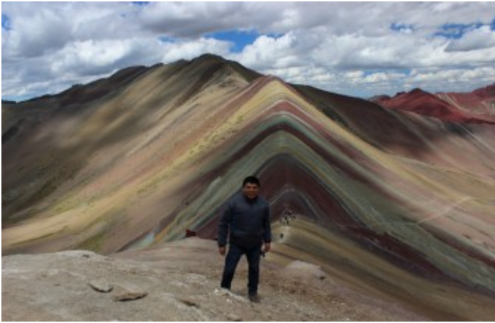
Valle de la Montaña de colores, Montaña Arco Iris, Rainbow Mountain (Jaime Briceno)