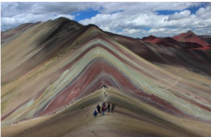
Valle de la Montaña de colores, Montaña Arco Iris, Rainbow Mountain (Jaime Briceno)