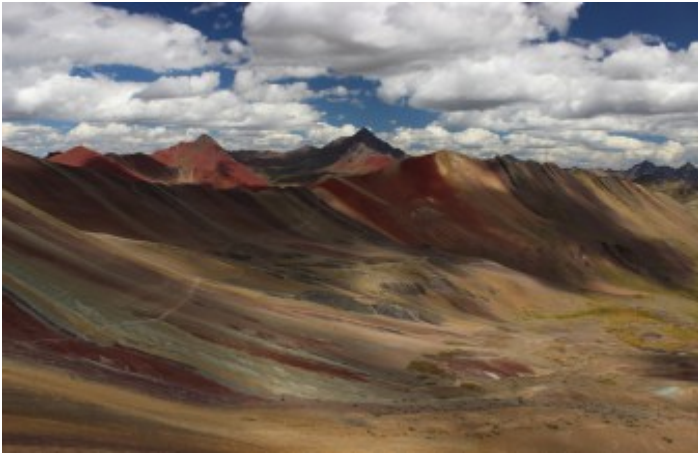
Valle de la Montaña de colores, Montaña Arco Iris, Rainbow Mountain (Jaime Briceno)