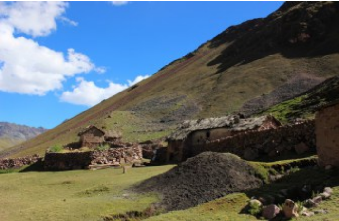
Valle Vinicunca (Jaime Briceno)