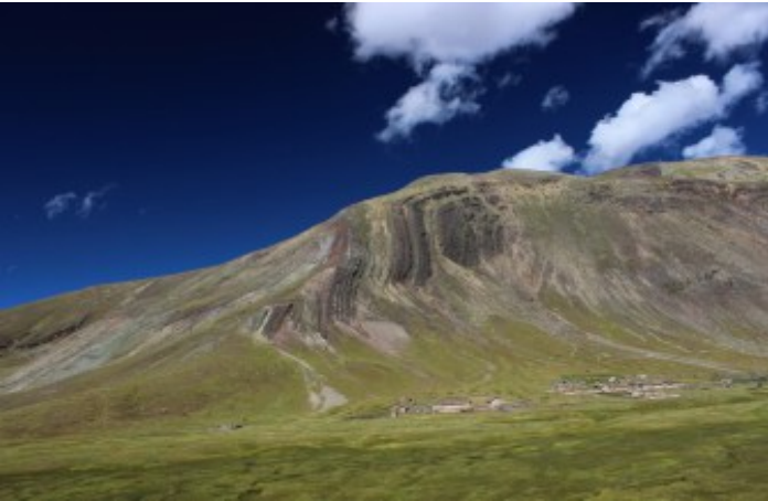
Valle Vinicunca (Jaime Briceno)