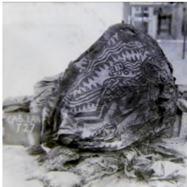
Img. 01: el manto pintado durante el proceso de desenfundamiento del fardo VII