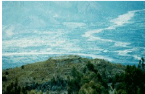
Restos Arqueológicos Yana Orco