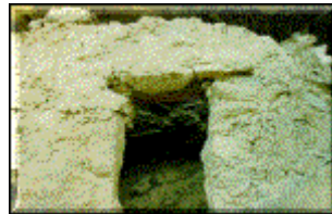
Restos de Cerro Yautorko – Yanas